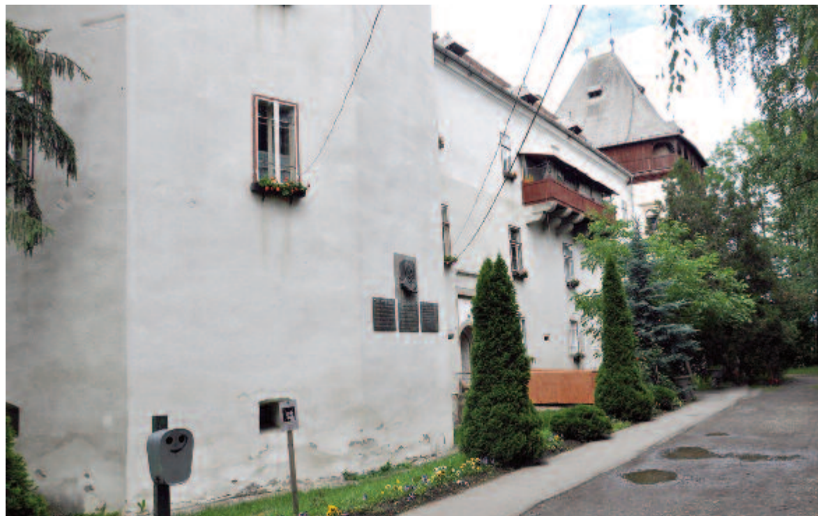
A marosvécsi kastély