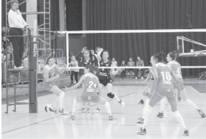
Az első játszma volt a legjobb a házigazdák számára, különösen a meccs eleje, amikor 10-10-ig tartani tudták a lépést a Bajnokok Ligájára összeállított világválogatottal.