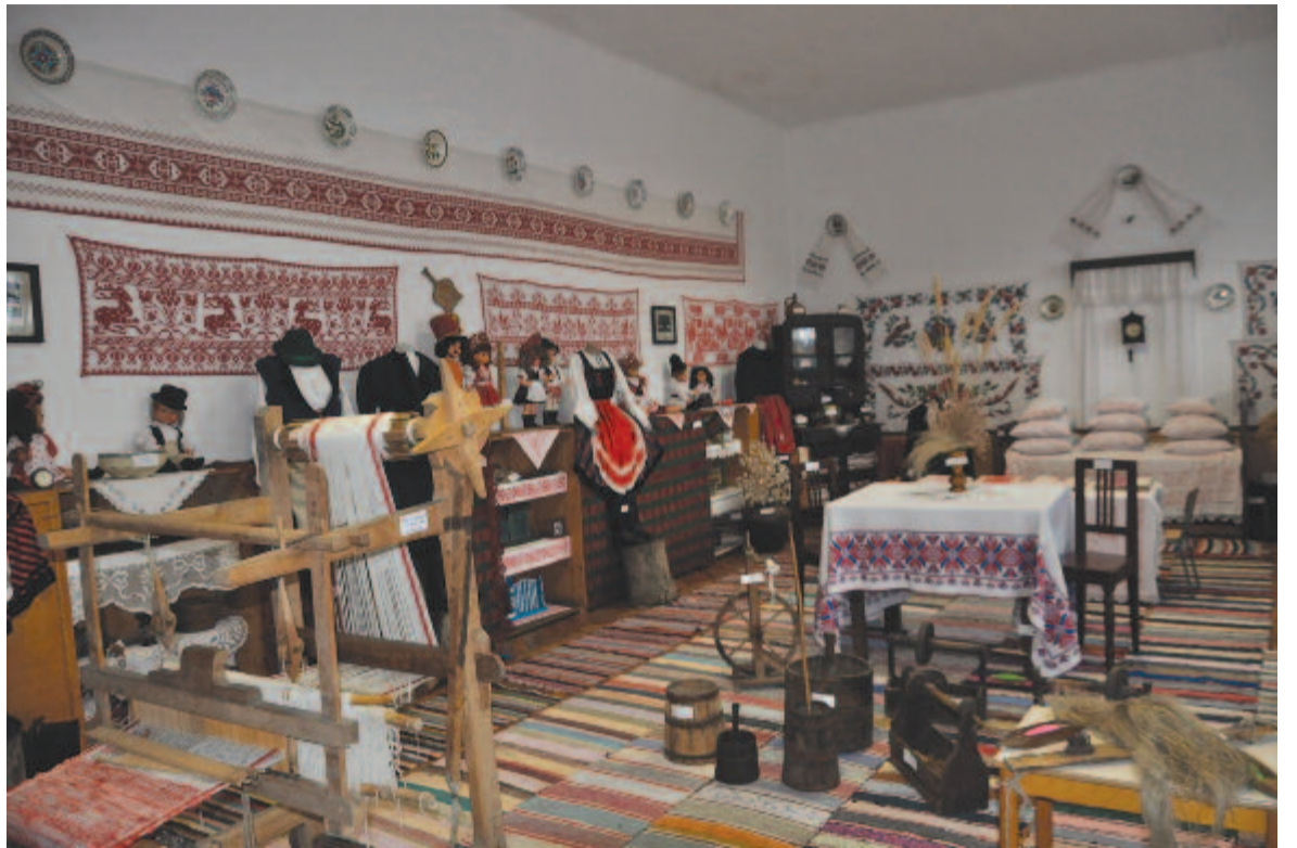
A disznajói falumúzeum