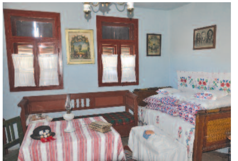
A magyarói tájház berendezése

1228-ban Mogoreu néven még csak mogyorócserejével benőtt helyként említik. A falu határában található Mentővár alapfalmaradványai. A várat 1319-ben említik először, kevéssel azelőtt építette